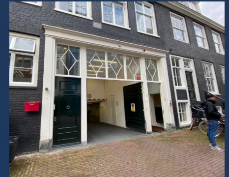
📍 Noorderstraat, Amsterdam