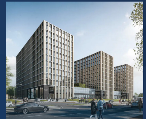
📍 Heineken Poland Partners: NTT & MAPIQ

“De kentekenherkenning werkt goed. Wij zijn erg blij met de samenwerking met Togethr.”