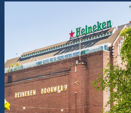
📍 Marie Heinekenplein Partners: Skidata & Apcoa