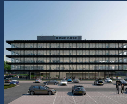
📍 The Base Schiphol Partners: Skidata